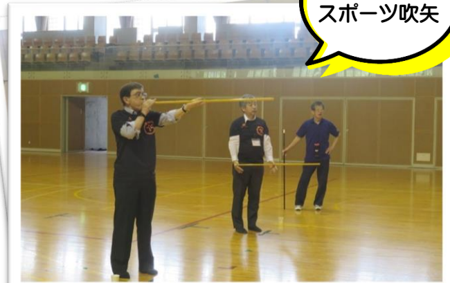
軽スポーツ スポーツ吹矢

雲南市教育委員会の景山教育長に軽スポーツ無料体験会のスポーツ吹矢を体験していただきました。