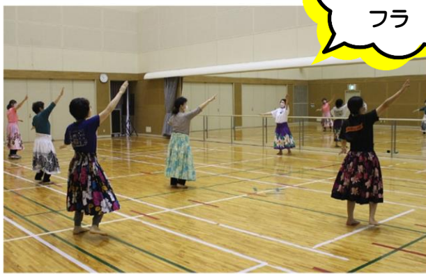
フィットネス フラ

初めて開催したフィットネスフラは、フラダンスのステップにフィットネスの要素を加えたもので、穏やかで優雅なフラを楽しみながら、無理なく安全にできるエクササイズです。